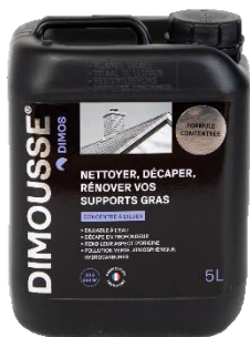
Ref. 444 170 DIMOUSSE Dégraissant concentré