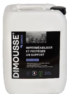
Ref. 444 150 DIMOUSSE Hydro