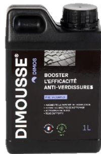
Ref. 444 180 DIMOUSSE Solution booster anti-verdissures