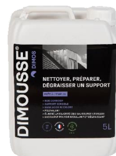
Ref. 444 160 DIMOUSSE Clean 2 en 1