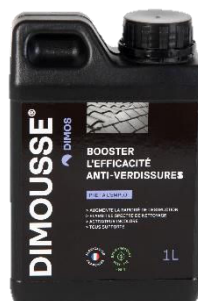
Ref. 444 180 DIMOUSSE Solution booster anti-verdissures