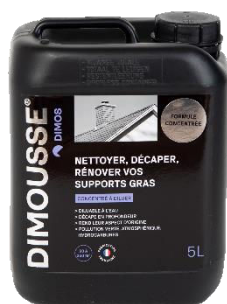
Ref. 444 170 DIMOUSSE Dégraissant concentré