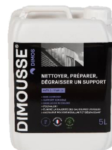
Ref. 444 160 DIMOUSSE Clean 2 en 1