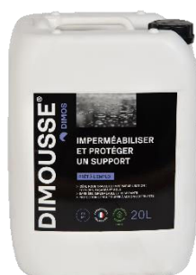
Ref. 444 150 DIMOUSSE Hydro