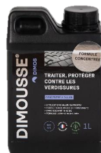
Ref. 444120 DIMOUSSE concentré X-Thallo anti traces vertes, traces noires et rouges