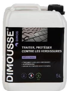
Ref. 444100 DIMOUSSE 2.0 Prêt à l'emploi anti-verdissure

Nos produits compatibles DIMOUSSE Clean 2 en 1 :