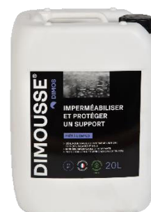
Ref. 444150 DIMOUSSE Hydro