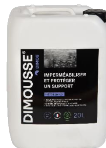
Ref. 444150 DIMOUSSE Hydro