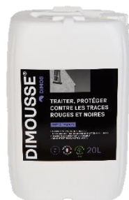
Ref. 444130 DIMOUSSE Algues