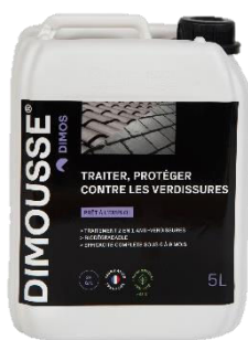
Ref. 444100 DIMOUSSE 2.0 Prêt à l'emploi anti-verdissure