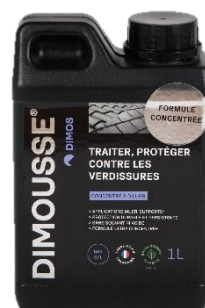
Ref. 444120 DIMOUSSE concentré X-Thallo anti traces vertes, traces noires et rouges